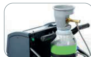
Mulighed for forskellige cylinderstørrelser