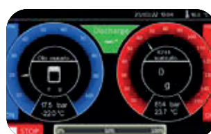
Automatisk styring af alle faser